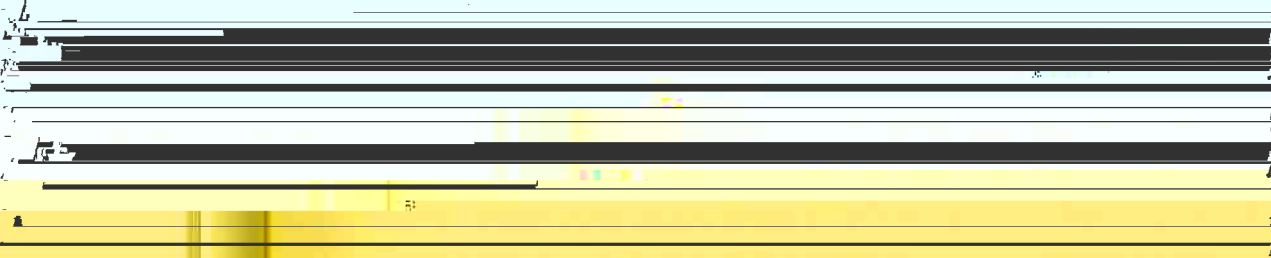
図 2.1 座標系と点 P(x, y) の位置関係

このように、座標系を用いて、平面上の点の位置を数値で表すことができます。このように、平面上の点の位置を数値で表すことを、座標表示といいます。