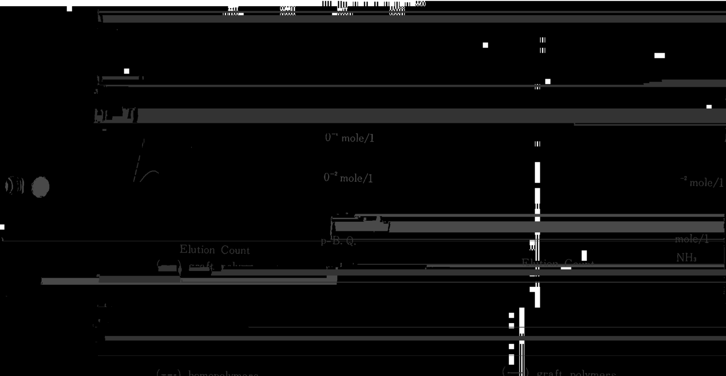
Fig. 5 GPC spectra with ammonia concentration.