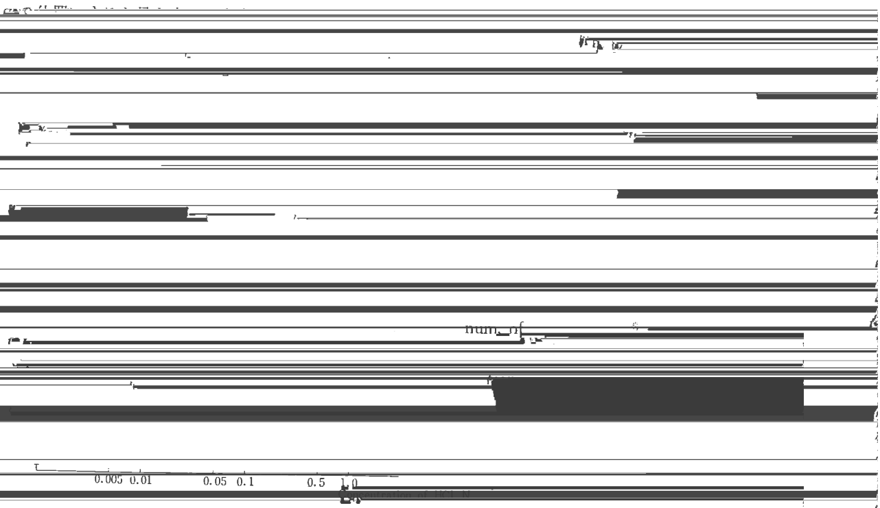
Fig. 3 Effect of HCl on the abundance of lead