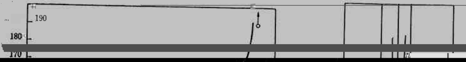
Fig. 2 Variation of the properties of chlorinated