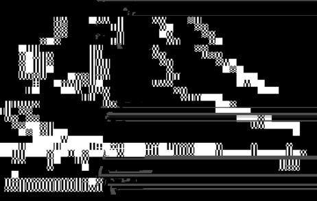
Fig. 1 Chromatogram of propylene oxidation reaction